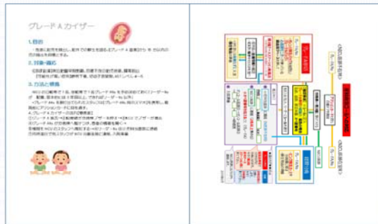
↑ 緊急帝王切開時の対応