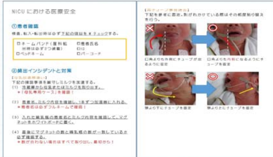
↑ 医療安全（患者確認等）