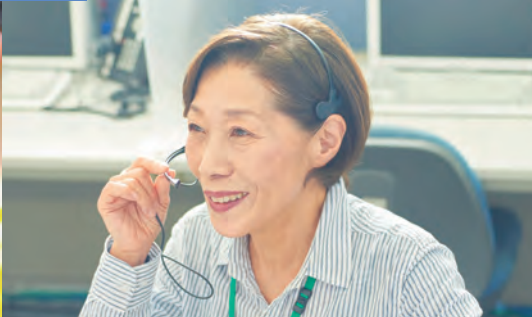
画像はイメージです。