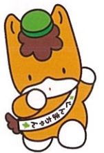
群馬県のマスコット 「ぐんまちゃん」 2019-100036

リレー・フォー・ライフは、がんに立ち向かう方々の勇気を称え、がん患者や家族、友人、支援者と共に地域一丸となってがん征圧を目指すチャリティー活動です。リレーイベント参加者は共に歩き語らうことで、がんへの理解が深まるとともに、あきらめない勇気、生きる希望を感じていただけたと思います。群馬県では7回目の開催となります。ぜひ会場においでください。